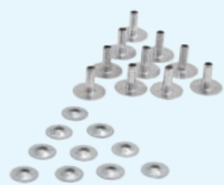
プローブキット (100セット) Model 3000-63