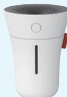
粒子発生器 Model 3000-84