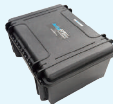
ハードタイプキャリングケース Model 3000-85