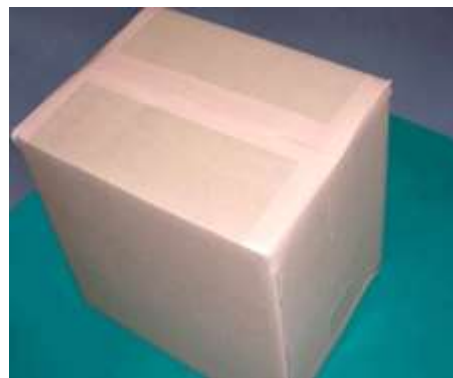
箱が開かない様しっかりと梱包