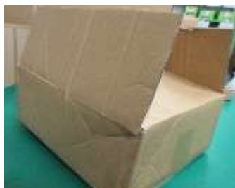
梱包箱自体が破損（穴あき）