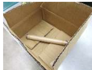
箱に緩衝材が詰められていない