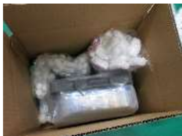
内容物が片寄っている