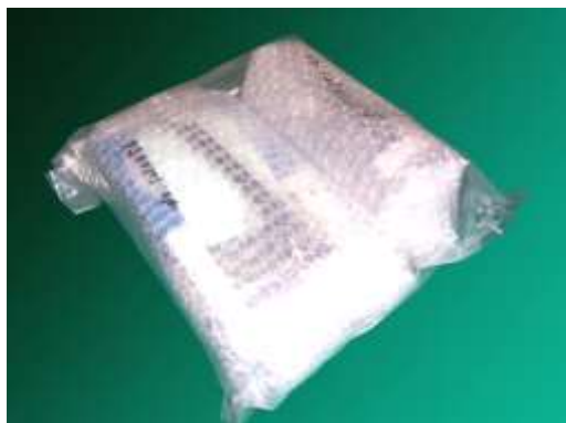
プローブ単体でのご発送

輸送時、本体やセンサーに傷が付いたり破損しないように、エアークャップや柔らかい布等で保護してください。