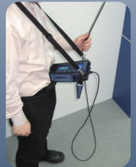
肩掛けケース使用例 ※別売です。

プローブ一体型の伸縮延長棒により利便性が大幅に向上 空調設備点検、性能評価、工程制御管理などに最適